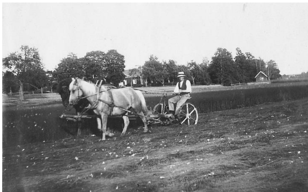
På bilden en okänd dräng på slättermaskinen med Silkesnäs mangårdsbyggnad i bakgrunden. Foto taget på 1930-talet.