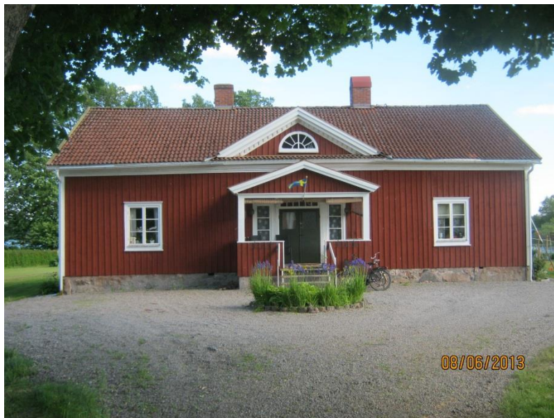
Silkesnäs mangårdsbyggnad byggd 1853.

Silkesnäs är ett gammalt frälsehemman och majorsboställe, vackert beläget på en udde i Åsnen ca två km öster om Torne. Gården är ett ganska vanligt, medelstort lantbruk i Småland.